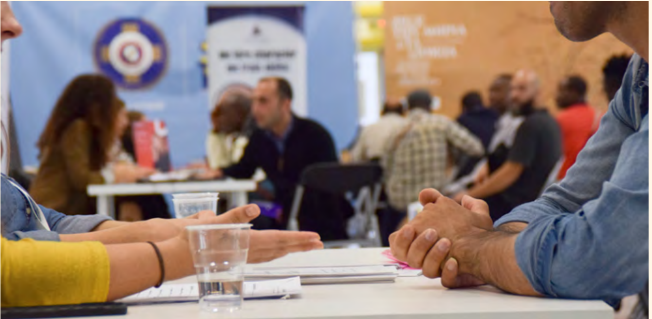
Η IRC Hellas συνδιοργάνωσε το πρώτο Job Fair στην Αθήνα το 2019, φέρνοντας κοντά εργοδότες με πρόσφυγες και μετανάστες σε αναζήτηση εργασίας. Generation 2.0 for Rights, Equality and Diversity

Τα προγράμματα ένταξης της IRC σε διάφορες χώρες του κόσμου έχουν σχεδιαστεί για να διασφαλίζουν ότι οι πρόσφυγες και οι αιτούντες άσυλο μπορούν να ευημερήσουν στις χώρες υποδοχής και να συνεισφέρουν στις τοπικές τους κοινότητες οικονομικά, κοινωνικά και πολιτιστικά. Η εξοικείωσή μας με χώρες που διαθέτουν πολύ διαφορετικές εμπειρίες μετανάστευσης βάσει της γεωγραφικής τους θέσης και των κοινωνικών, οικονομικών και ιστορικών πλαισίων, ενισχύει την ικανότητά μας να παρέχουμε υπηρεσίες ένταξης λαμβάνοντας υπόψη μια μεγάλη ποικιλία διαρθρωτικών παραγόντων. Στις ΗΠΑ, η IRC έχει πολυετή εμπειρία στην υποδοχή περισσότερων από 400.000 προσφύγων. Στην Ευρώπη, εφαρμόζουμε επί του παρόντος προγράμματα ένταξης, τόσο άμεσα όσο και μέσω εταιρών στη Γερμανία και την Ελλάδα, καθώς και μέσω ενός διευρυμένου δικτύου 16 επιπλέον χωρών μέσω του προγράμματος Ευρωπαϊκής Τεχνικής Βοήθειας Μετεγκατάστασης και Ένταξης (EURITA) 11 . Από αυτή την εμπειρία γνωρίζουμε ότι, αν τους δωθούν οι κατάλληλες ευκαιρίες, οι πρόσφυγες και οι αιτούντες άσυλο μπορούν να συμβάλουν ουσιαστικά στις τοπικές οικονομίες ως καταναλωτές, εργαζόμενοι και ιδιοκτήτες επιχειρήσεων.